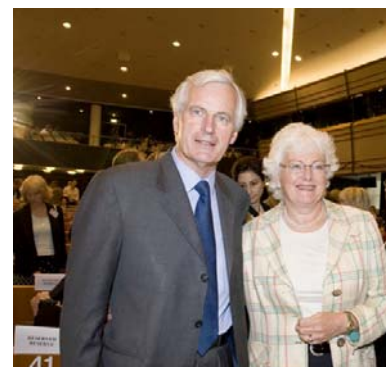
Mariann FISCHER BOEL, Commissaire chargée de l'Agriculture et Michel BARNIER

Le débat pour la programmation du budget européen 2014-2020 s'engagera à la fin 2009, avec la nouvelle Commission Européenne et le nouveau Parlement.